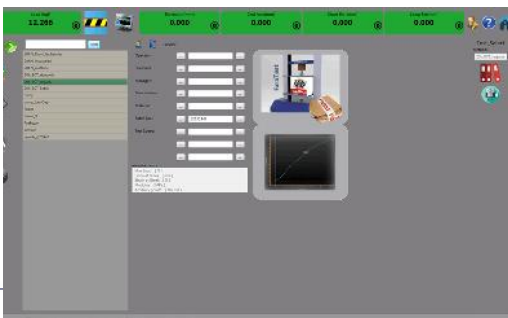
متمدهای از پیش آماده طبق استانداردهای ملی و جهانی