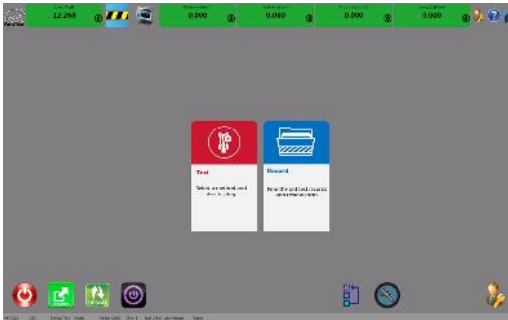
رابط کاربری آسان و کاربر پسند